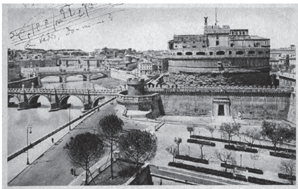
Widokówka z Rzymu z pierwszymi taktami Quo vadis