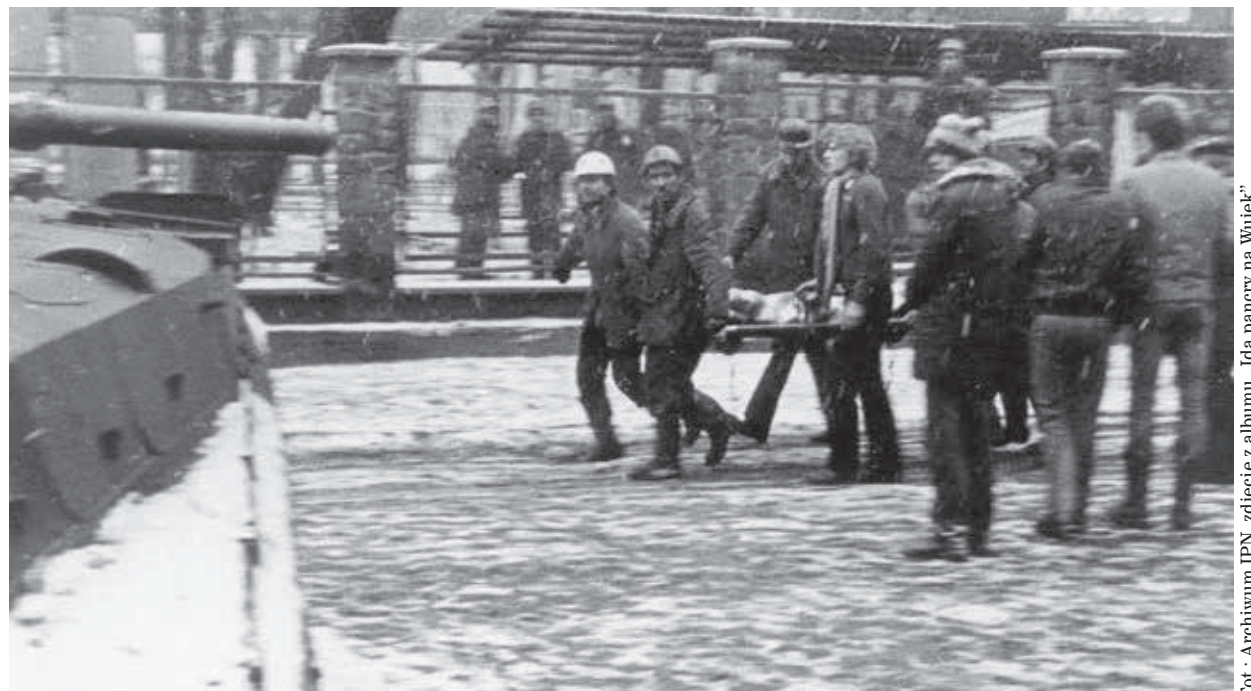
zdjęcie z albumu „Idą panicy na Wujek”