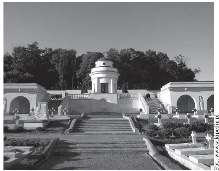
Kaplica z okresu budowy Cmentarza i pielgrzymka z Gdańska