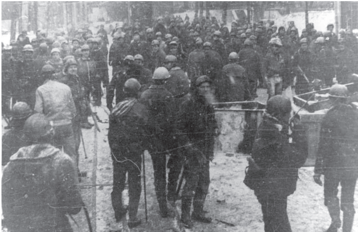
Fot.: Archiwum IPN, zdjęcie z albumu „Ida pancerny na Wujek”

Śląskie Centrum Wolności i Solidarności, które mieści się obok kopalni „Wujek” oraz Pomnika Krzyża Dziewięciu Górników i prowadzi Muzeum Izbę Pamięci Kopalni Wujek, od początku roku koordynuje wydarzenia związane z Rokiem Pamięci. Wystawa „Kopalnia strajkuje...” przygotowane przez ŚCWIS oraz Społeczny Komitet Pamięci Górników KWK Wujek Poległych 16 grudnia 1981 r. od stycznia odwiedziła wiele